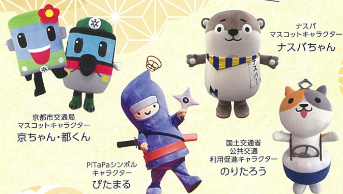
京都市交通局 マスコットキャラクター 京ちゃん・都くん