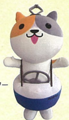
ナスバ マスコットキャラクター ナスバちゃん

※都合により登場するキャラクターは変更になる場合がございます。※写真はイメージです。