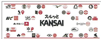
サイズ: 約330mm×900mm 素材: コットン

スルッとKANSAI協議会加盟バス事業者のロゴとバス停円盤をデザインした手ぬぐいです。